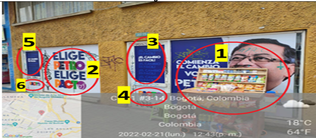
Foto 6, En la cual se pueden identificar seis (6) elementos ubicados sobre la carrera 3, los elementos 1 y 2 se encuentran incorporados en las ventanas con texto publicitario, elemento 1 “COMIENZA EL CAMBIO + VOTA POR +PETRO + imagen del candidato”, elemento 2 “ELIGE+ PETRO+ELIGE+PACTO”, los elementos 3, 4, 5 y 6 se encuentran incorporados en las puertas, con texto publicitario elemento 3 y 5 ¡EL CAMBIO FÁCIL! y los elementos 4 y 6 “PACTO”