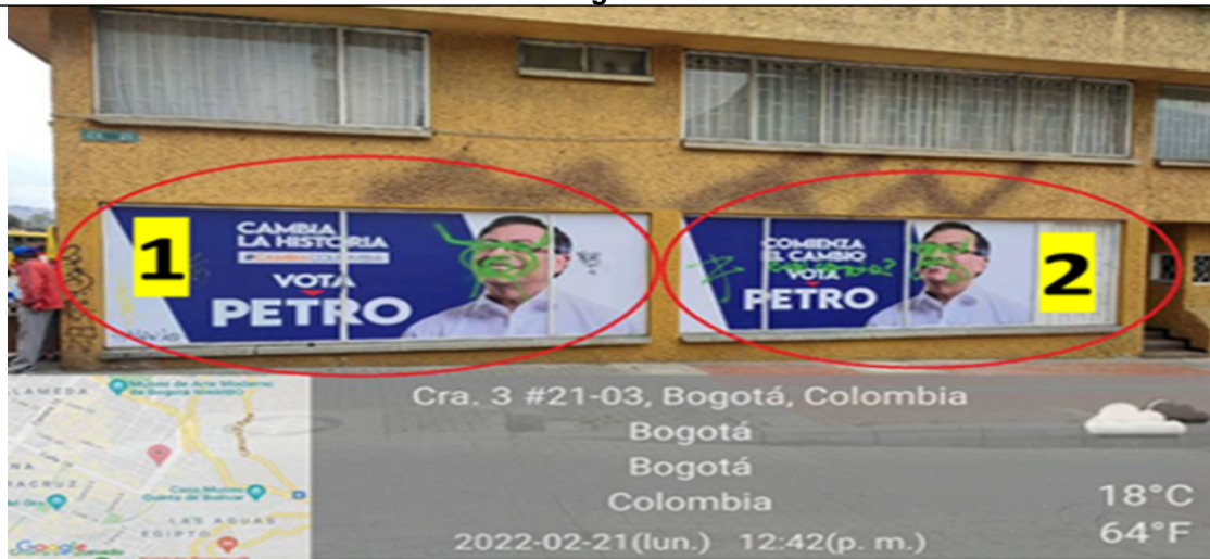
Foto No.5. En la cual se pueden identificar dos (2) elementos incorporados en las ventanas del primer piso del inmueble con vista hacia la calle 21, los cuales contienen el texto publicitario (texto elemento 1 “CAMBIA LA HISTORIA + #CAMBIACOLOMBIA+VOTA POR PETRO + imagen del candidato”, texto elemento 2 “, COMIENZA EL CAMBIO + VOTA POR +PETRO + imagen del candidato).